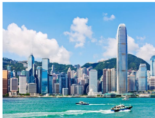
屋間の香港島の摩天楼。夜は100万ドルの夜景に