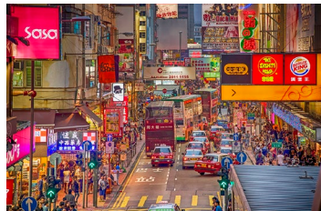
オープントップバスが看板の下を頭ギリギリに走る名物通り